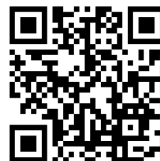
コラボレもおか ブログページ