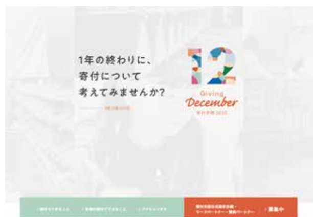
寄付月間ウェブサイトのトップページ