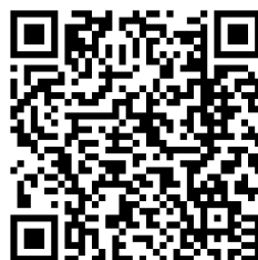
コラボレもおか 公式YouTubeチャンネル

暗いニュースが多い昨今、取材団体の元気な活動の様子が伝わり、同様に、「我々の団体の活動の取材も行ってほしい」という声が届くのをお待ちしています。